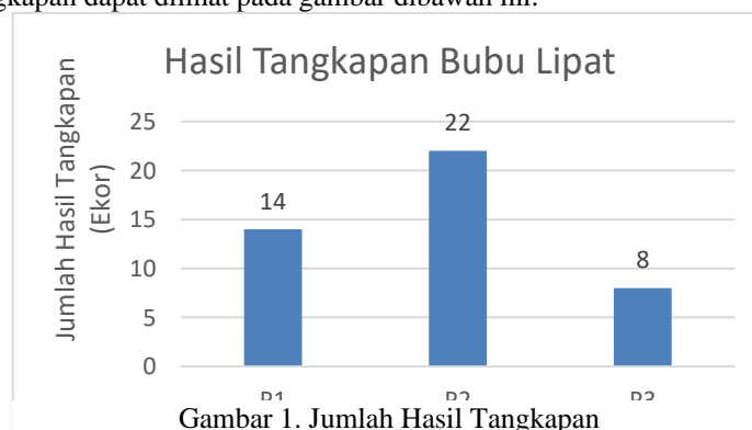
Gambar 1. Jumlah Hasil Tangkapan

Berdasarkan hasil penelitian yang telah dilakukan, diketahui bahwa jumlah tangkapan rajungan berbeda pada setiap perlakuan celah pelolosan. Perlakuan P1 menghasilkan 14 ekor, perlakuan P2 menghasilkan 22 ekor, dan perlakuan P3 menghasilkan 8 ekor, dengan total keseluruhan 44 ekor. Untuk histogram hasil tangkapan dapat dilihat pada gambar dibawah ini: