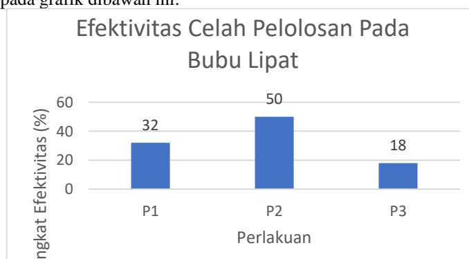
Gambar 2. Efektivitas Celah Pelolosan

Efektifitas Celah pelolosan ( Escape Gap ) pada bubu lipat terhadap hasil tangkapan Rajungan pada bubu lipat dapat dilihat pada grafik dibawah ini: